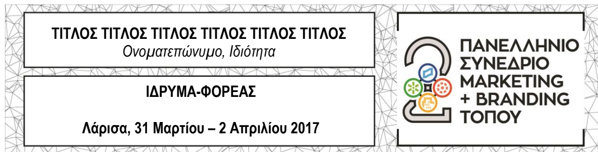
Σχήμα 2: Διαγραμματικά layout Ζώνης Τίτλων